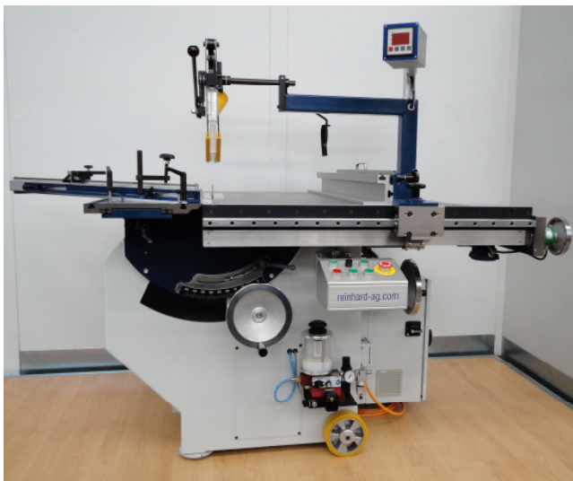
konventionell mit Digitalanzeige und Sprühvorrichtung