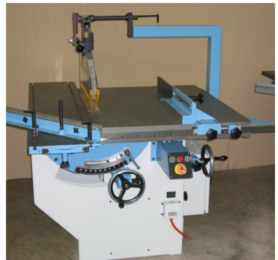
konventionell ohne Digitalanzeige