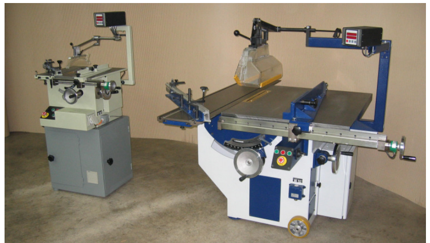
PKN 350 im Vergleich zur PKN 200